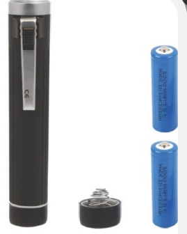
MINİ ELCEK STANDART SMDMHS420