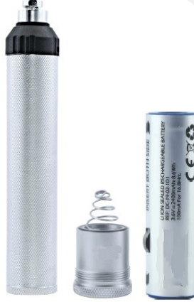
ELCEK ŞARJLI SMDHS400