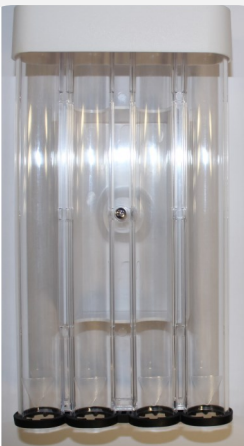
SPEKULUM KUTUSU SMD1650