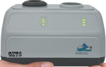
GÜÇ KUTUSU SMDSC600