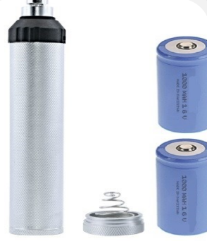
ELCEK STANDART SMDHS410