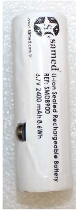
GÜÇ PAKETİ 3.7V LI-ON SMDB900