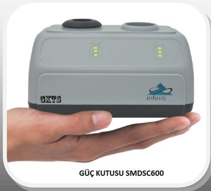
GÜÇ KUTUSU SMDSC600