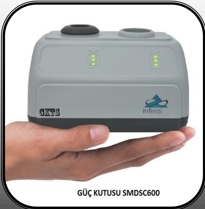
GÜÇ KUTUSU SMDSC600